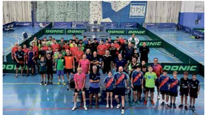
Participantes en el Open Tenis de Mesa Binéfar.