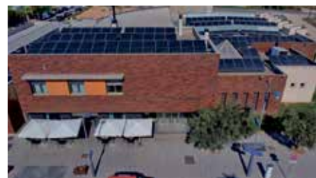
Últimas placas fotovoltaicas instaladas, concretamente en el Centro Cultural y Juvenil.

El alcalde de Binéfar, Alfonso Adán, ha indicado que "es muy importante la labor en el fomento de las energías renovables que se ha ido desarrollando en nuestra localidad en los últimos años, del que ahora vemos los frutos y la recompensa en este galardón que nos ha concedido la FEMP, que reconoce el esfuerzo por la sostenibilidad a través del ahorro en consumos energéticos, incluso antes de que se precipitara la actual crisis, y del respeto al medio ambiente que representa".