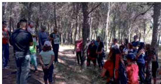
Una de las paradas para observar la flora.

Un nutrido grupo de personas disfrutaron de la excursión guiada a la Sierra de San Quílez de Binéfar que organizó el Ayuntamiento de Binéfar, a través de su área de Medio Ambiente, y que llevó a este espacio verde a casi una cuarentena de adultos y niños.