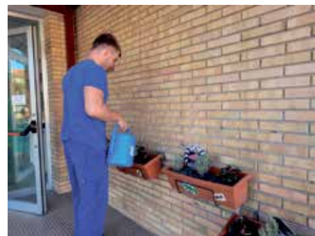
Trabajos de mantenimiento en el CEIP Víctor Mendoza.