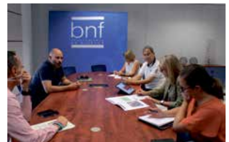
🕒 Reunión en alcaldía para perfilar el diseño del nuevo pabellón del Segalar.

balonmano, baloncesto y bádminton, aunque todos estos detalles se irán perfilando a medida que avance el proyecto constructivo.