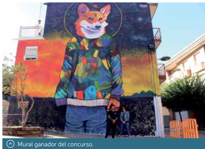
Mural ganador del concurso.

Tres nuevos murales de gran formato, que abordan distintos temas, son el resultado del V Concurso de Arte Urbano convocado por el Ayuntamiento de Binéfar. Se unen a los de anteriores ediciones, repartidos por distintos puntos de la localidad, y conforman un circuito de interés artístico que aporta valor a las zonas donde se ubican.