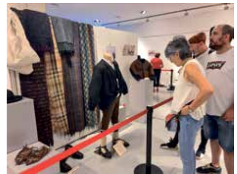
⤴ La muestra despertó mucha curiosidad entre los visitantes.