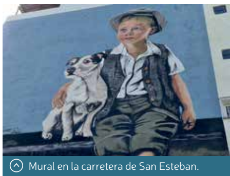
Mural en la carretera de San Esteban.

La iniciativa del Concurso de Arte Urbano tiene gran acogida entre la población, por lo que se invita a los interesados en prestar sus paredes a inscribirse para la próxima edición. La actividad está financiada por la Diputación Provincial de Huesca y el Instituto Aragonés de la Juventud, asimismo, cuenta con el patrocinio de las empresas Pinturas Lepanto, que pone material, y Salamero Ferretería Industrial, que aporta las máquinas elevadoras.