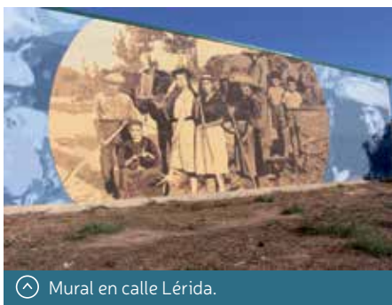
Mural en calle Lérida.