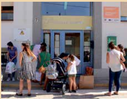
Las familias esperando la apertura de la Escuela Infantil.

El centro y las profesionales que lo atienden, como es habitual, hicieron muy fácil el regreso o el ingreso –de-