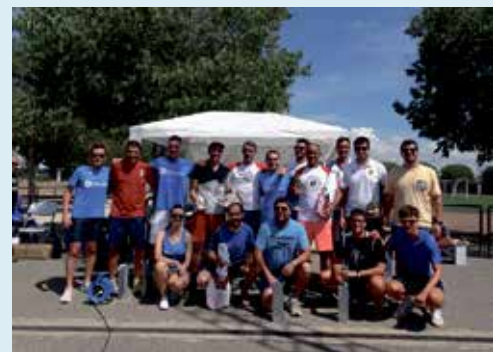
Torneo de tenis pádel.