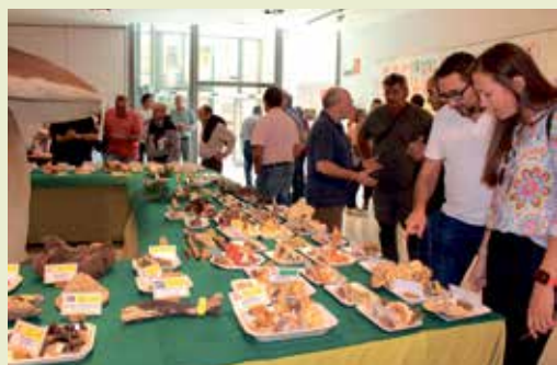
Exposición. Premiados. Paella de setas.

La mañana se completó con el reparto de una deliciosa paella de setas, que cuenta ya con muchos habituales, que cocina Mister Plat, socio de la entidad organizadora. La actividad cuenta con la subvención de la Diputación Provincial de Huesca.