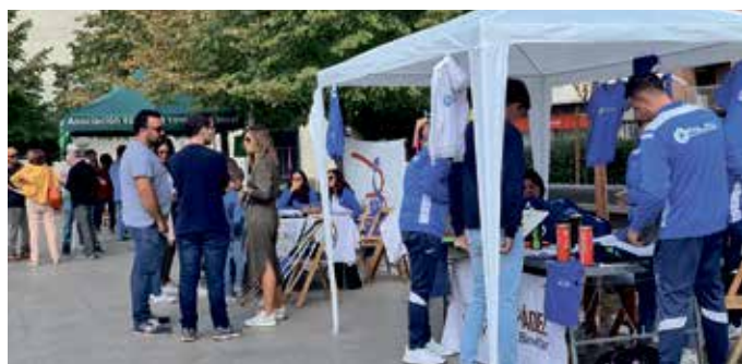
Las asociaciones mostraron su oferta en la plaza de España.

La II Feria de Asociaciones de Binéfar reunió en la plaza de España a dieciocho entidades socioculturales y deportivas locales. La finalidad de esta feria, que nació el pasado año, es facilitar a las asociaciones dar a conocer su actividad al resto de ciudadanos.