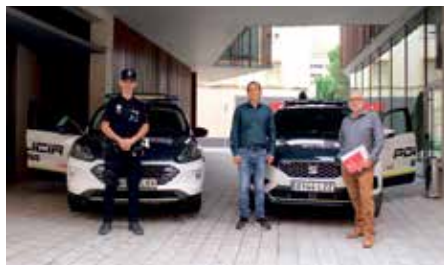
Recepción del segundo coche patrulla híbrido para la Policía Local.

En relación con estas iniciativas, se han instalado puntos de recarga para vehículos eléctricos en la vía pública, asociados a la instalación fotovoltaica de la Casa Consistorial y del Centro Cultural. Asimismo, se está desarrollando un plan de electrificación del parque de vehículos municipal,